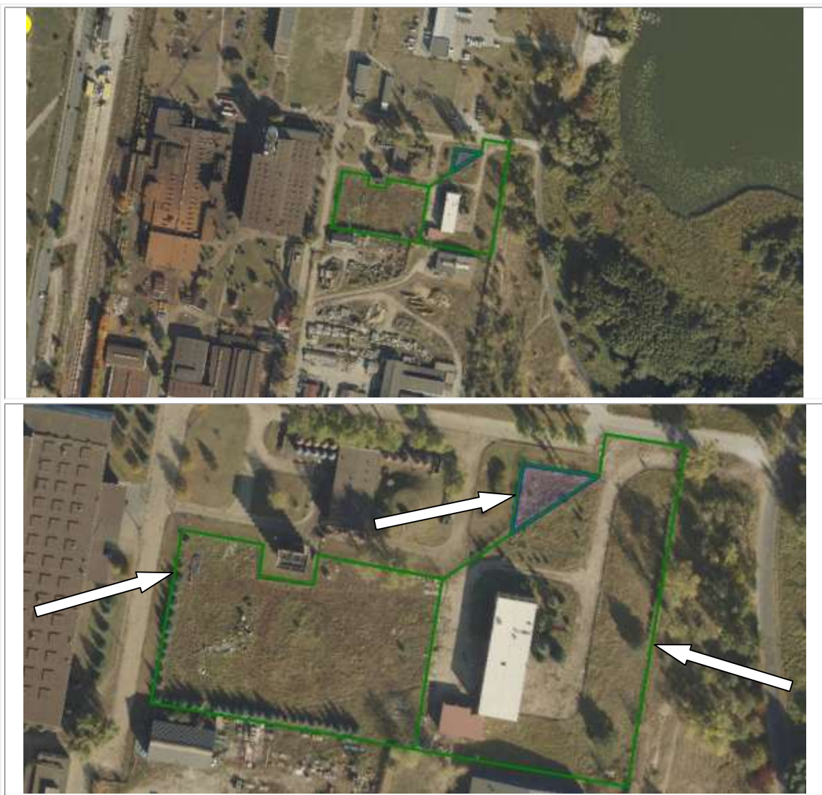
Tabela 3. Opis nieruchomości – działka gruntu