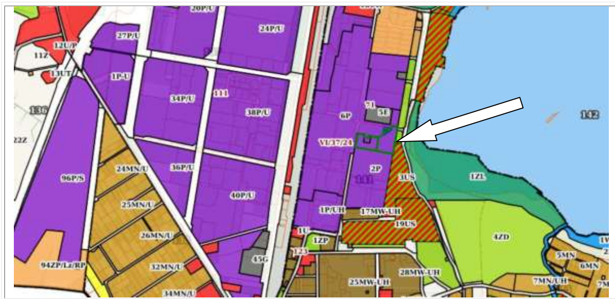
Tabela 1. Przeznaczenie w MPZP

Wyceniana nieruchomość położona jest w obszarze objętym miejscowym planem zagospodarowania przestrzennego nr 71 - MPZP `Mniszek Przemysłowy, obejmujący teren ograniczony ulicą Jeziorną, brzegiem Jeziora Wielkiego Rudnickiego do działki nr 1/1 obręb 142, ulicą Malczewskiego, terenem KS Stal, ulicami Olchową, Metalowców i linią kolejową (Uchwała Nr XIII/117/07 Rady Miejskiej Grudziądza z dnia 26 września 2007 r.), oznaczona symbolem -P jako tereny produkcji, składów i magazynów.