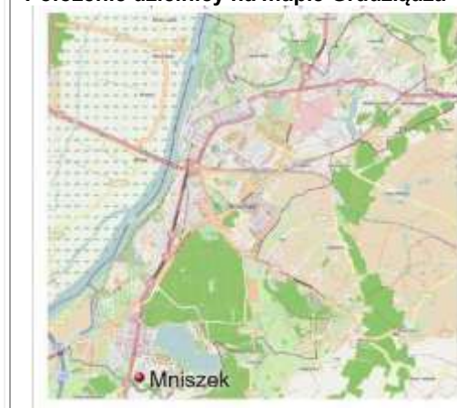
Położenie dzielnicy na mapie Grudziądza

Mniszek z innymi dzielnicami miasta łączą miejskie linie autobusowe: 10, 17, 19, 21, 22 oraz powiatowe linie autobusowe P8, P9. W Mniszku znajdowała się kiedyś końcowa mijanka tramwajowa, lecz w 1978 r. została ona zlikwidowana. Możliwy jest dojazd także pociągami przewoźnika Arriva do Grudziądza, Brodnicy, Torunia i Chełmży, zatrzymującymi się na tutejszej stacji Grudziądz Mniszek leżącej na linii kolejowej numer 207.