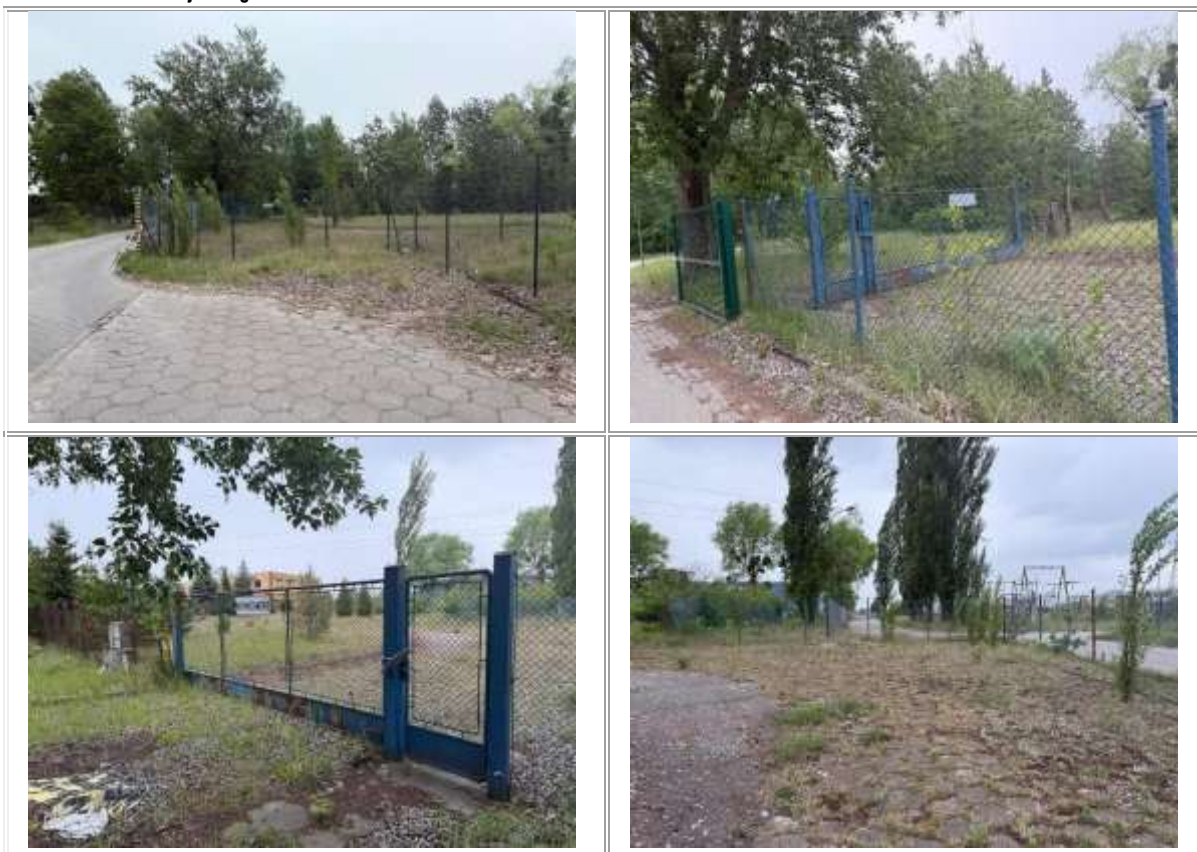
Tabela 6. Dokumentacja fotograficzna